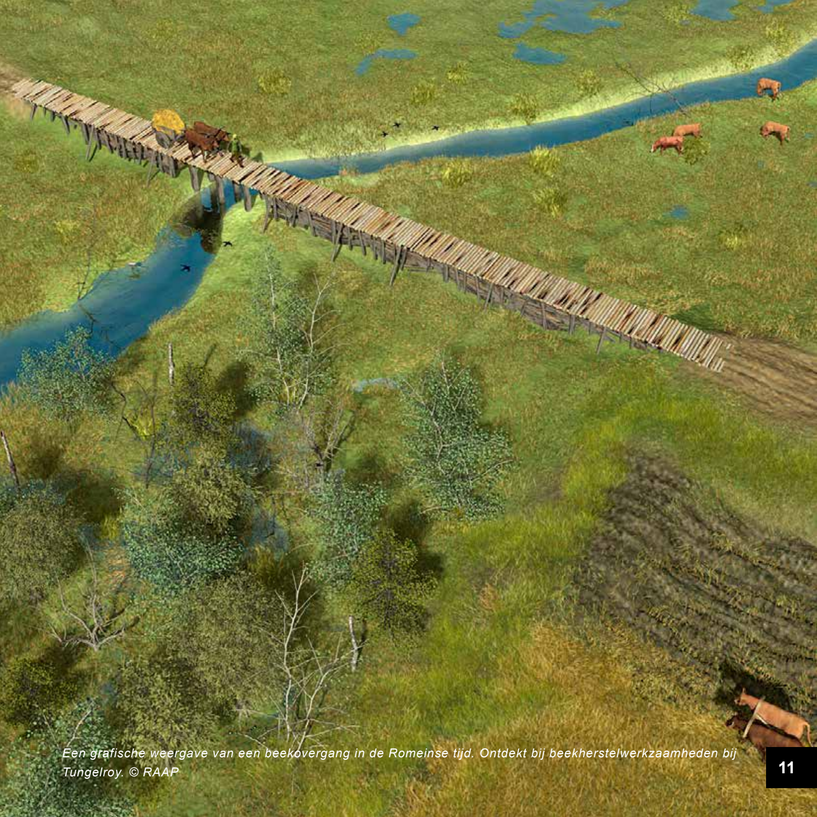
Een grafische weergave van een beekovergang in de Romeinse tijd. Ontdekt bij beekherstelwerkzaamheden bij Tungelroy.