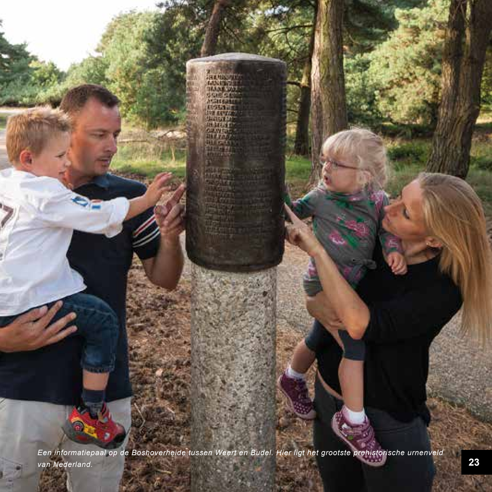
Een informatiepaal op de Boshoverheide tussen Weert en Budel. Hier ligt het grootste prehistorische urnenveld van Nederland.