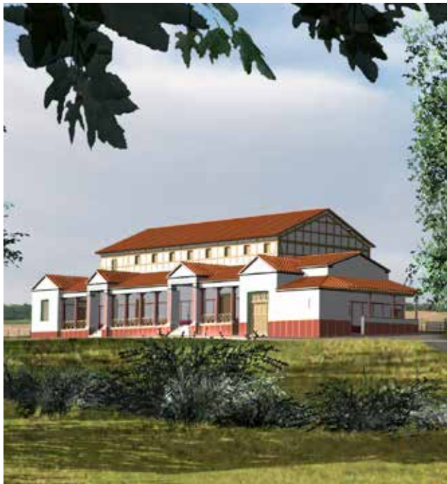
Impressie van de Villa Kerkrade-Holzkuil, een soort herenboerderij. Er waren tientallen van deze villa's in Limburg. © PANSA BV – Kees Peterse (reconstructie), Gerard Jonker (computerstill)

Voor deze actielijn stellen wij € 1.000.000 beschikbaar voor de periode 2016 – 2019.