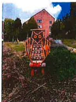
insectenhotel In de Timpaantuin