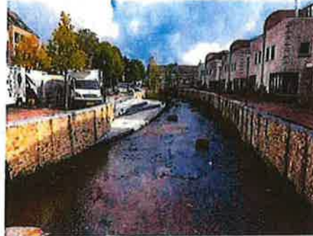
Aanpassen Gulp (Looierstraat)