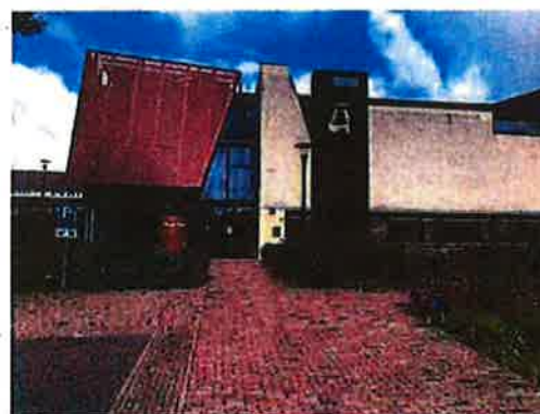
BMV entree. Stichting 't-Gulper Hoes voert exploitatie