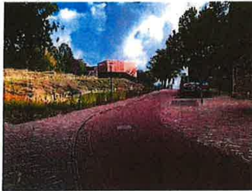
Kapelaan Pendersplein - Rosstraat