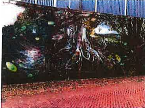
Mural Yasja in de Rosstraat