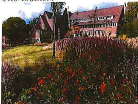
Timpaantuin met bloemen, planten en bomen