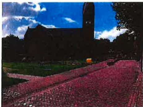
Kiebeukel - Timpaantuin