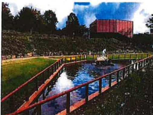
BMV geïntegreerd in de Timpaantuin