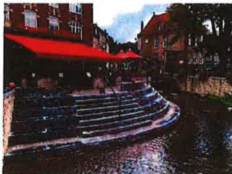
Trappenpartij Gulp (Loolerstraat)