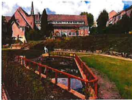
Vijver met fontijn In de Timpaantuin

Bovenstaande foto's geven een impressie van de metamorfose die het centrum van Gulpen heeft ondergaan. Het centrum is voor en in samenspraak met de omgeving uitgevoerd en heeft gezien alle positieve reactie het gewenste eindresultaat opgeleverd. De omgeving en ook de gemeente zijn trots op het nieuwe centrum. De werkzaamheden zijn gereed en opgeleverd, maar er zijn nog een aantal wensen, zoals het aanbrengen van enkele thematuinen in de Timpaantuin en het aanbrengen van het kunstwerk "de Timpaan". In de komende periode zal in overleg en samenspraak met bewoners en ondernemers een plannetje opgesteld worden voor de thematuinen.