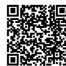
Bekijk de publicatie van nevenwerkzaamheden van ambtenaren

Ambtenaren van de Provincie Limburg staan midden in de maatschappij. Ze zijn actief in het verenigingsleven, in stichtingen en andere organisaties. Dat is positief, want zo weten zij wat er in de samenleving omgaat. Er zijn echter ook grenzen aan de mogelijkheden om als ambtenaar nevenwerkzaamheden te verrichten. Ambtenaren zijn daarom verplicht om opgave te doen van nevenwerkzaamheden die zij verrichten, wanneer deze raakvlakken kunnen hebben met hun hoofdfunctie bij de Provincie. Dit is in de Ambtenarenwet bepaald. De gedragscode licht toe in welke gevallen medewerkers hun leidinggevende om toestemming voor nevenwerkzaamheden moeten vragen. Dit om eventuele integriteitsrisico's, (de schijn van) belangenverstrengeling of imago-problemen voor de ambtenaar of de Provincie te voorkomen. Nevenwerkzaamheden die raakvlakken kunnen hebben met de hoofdfunctie bij de Provincie worden geregistreerd. Op grond van de Ambtenarenwet 2017 moeten bepaalde nevenfuncties bovendien openbaar worden gemaakt. In de gedragscode is vastgelegd dat dit in onze organisatie geldt voor de ambtenaren werkzaam in salarisschaal 14 en hoger. De publicatie van de nevenwerkzaamheden is te vinden op de website van de Provincie en wordt voortdurend actueel gehouden.