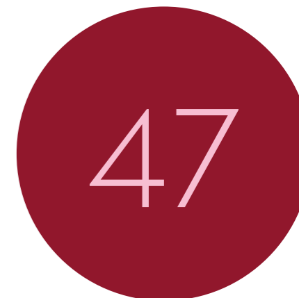
Gewijzigde meldingen nevenwerkzaamheden

Sociale veiligheid is een groot maatschappelijk thema waar wij ook in 2023 aandacht aan hebben besteed. Eind 2023 heeft een informatieve en interactieve bijeenkomst plaatsgevonden, waar alle leidinggevenden binnen de Provincie Limburg aan hebben deelgenomen. Doel van deze bijeenkomst was om sociale veiligheid te bespreken en samen te kijken hoe gehandeld moet worden op het moment dat er signalen van een onveilige sociale werkomgeving worden opgevangen. In 2023 zijn voorbereidingen gestart voor de uitwerking van een protocol. Hier wordt in 2024 verder vorm aan gegeven.