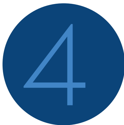
Ontheffingen voor verboden handelingen verleend door Gedeputeerde Staten

Als portefeuillehouder integriteit is de commissaris van de Koning belast met de uitvoering van het Beleidskader verboden handelingen. De Gemeentewet benoemt voor raadsleden een aantal verboden handelingen, bijvoorbeeld het als advocaat of adviseur werkzaam zijn voor de gemeente of het gemeentebestuur. Voor wethouders en burgemeesters geldt eenzelfde soort bepaling in de Gemeentewet. Gedeputeerde Staten kunnen voor het aangaan van overeenkomsten aan raadsleden en wethouders een ontheffing verlenen. De commissaris van de Koning kan een ontheffing aan een burgemeester verlenen. De ontheffing wordt verleend mits het belang van de gemeente of derden niet wordt geschaad en de aanvrager niet wordt bevoordeeld.