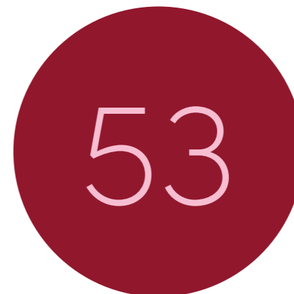
Nieuwe meldingen nevenwerkzaamheden

Medewerkers van de Provincie Limburg kunnen zich inschrijven voor diverse interne en externe opleidingen, cursussen en trainingen over integriteit en goed ambtelijk vakmanschap. Dit kan via de Limburg Academie, het digitale leerplatform van de Provincie Limburg. Het interne cursusaanbod bevat een aparte module 'Integriteit'. Deze wordt gegeven door Team Integriteit en de interne vertrouwenspersoon. Daarnaast biedt de Limburg Academie sinds enkele jaren de interne leerlijn Ambtelijk Vakmanschap aan. Deze is gericht op versterking van de basiskennis en vaardigheden van de ambtenaar, waarbij ook wordt