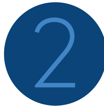
Bijeenkomsten Stuurgroep Kwaliteit Openbaar Bestuur

Bekijk de website www.integriteitlimburg.nl