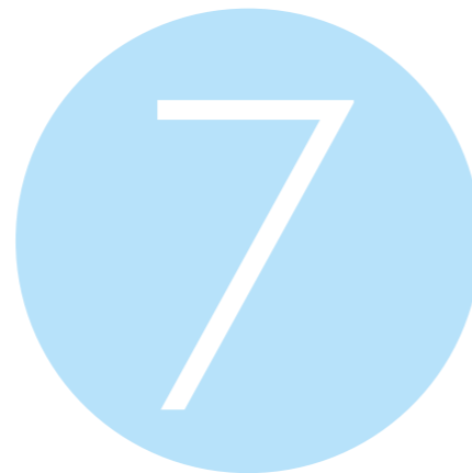
Integriteitsspiegelgesprekken bij wisselingen Statenleden van maart t/m december 2023