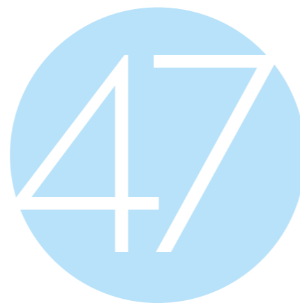
Integriteitsspiegelgesprekken bij aantreden nieuwe Statenleden

Publieke bestuurders liggen in toenemende mate onder een maatschappelijk vergrootglas. Om bewustwording te creëren en de kwetsbaarheden van aanstaande Statenleden zo goed mogelijk te kunnen inschatten/bespreekbaar te maken, vindt de commissaris van de Koning het belangrijk om met iedere kandidaat voor de Provinciale Staten aan de hand van een integriteitsspiegel in gesprek te gaan. Na benoeming, maar vóór het onderzoek van de geloofsbrieven en de installatie, vindt dit gesprek met de commissaris van de Koning, de griffier en de extern adviseur Integriteit plaats. Ieder (nieuw) Statenlid heeft, sinds de start van de nieuwe Provinciale Statenperiode in 2023, zo'n gesprek gehad.