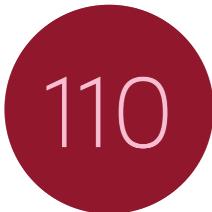
Nieuwe medewerkers legden de ambtseed of -belofte af