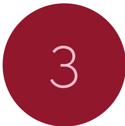
Workshops nieuwe medewerkers