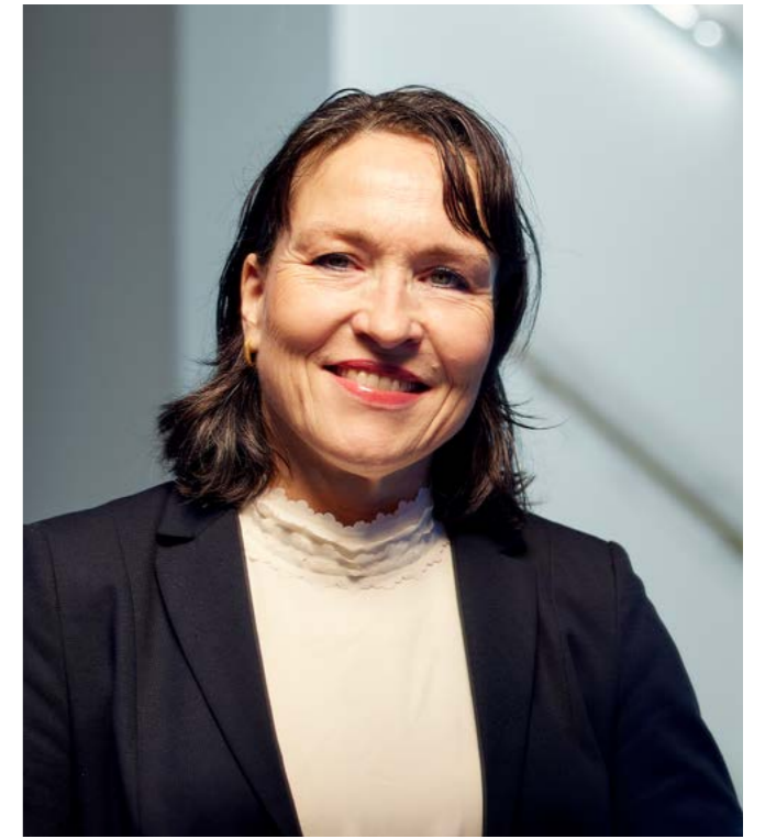
3. Gedeputeerde Staten Elianne Demollin-Schneiders