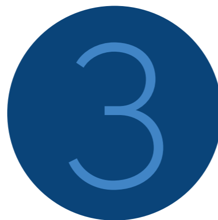
Verzoeken tot vernietiging van een raadsbesluit ingediend bij Gedeputeerde Staten

Op grond van de Gemeentewet kan een besluit of een niet-schriftelijke beslissing worden vernietigd als dit besluit of deze beslissing in strijd is met het recht of het algemeen belang. Het college van Gedeputeerde Staten kan dit aan de betrokken minister mededelen. Een besluit of beslissing wordt alleen vernietigd als vernietiging gerechtvaardigd is en dit in verhouding staat tot het doel. We zien de laatste tijd steeds meer dat derden zich rechtstreeks tot Gedeputeerde Staten richten met het verzoek om een besluit van een gemeenteraad en/of college ter vernietiging voor te dragen. Dit gebeurt vaak nadat de desbetreffende burgemeester dit heeft geweigerd.