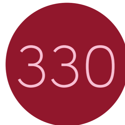
Op 31 december 2023 zijn er 199 medewerkers geregistreerd die samen 330 nevenfuncties hebben

Om het registreren van nevenactiviteiten makkelijker te maken zijn in 2023 de algemene processtappen voor medewerkers en leidinggevenden toegevoegd aan het interne intranet. Ook is hier een handleiding voor het digitale registratiesysteem aan toegevoegd.