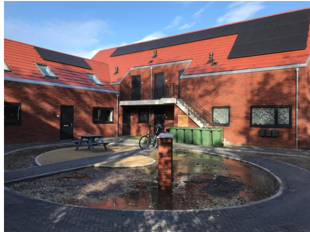
Mgr. Nolensstraat 5 t/m 5J