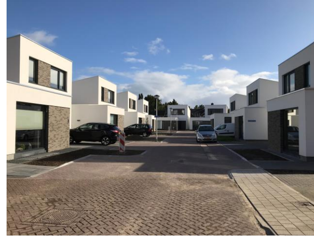
Werf 1 t/m 9