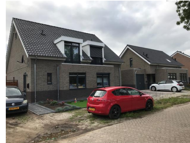
Past. Schippersstraat 34 t/m 40