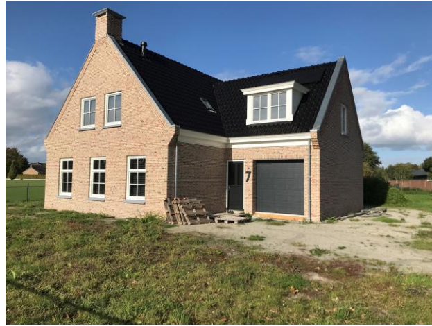
Tungeler Dorpsstraat 7