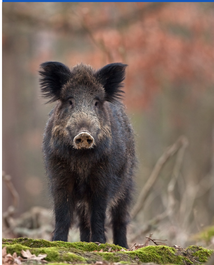
Volwassen wild zwijn